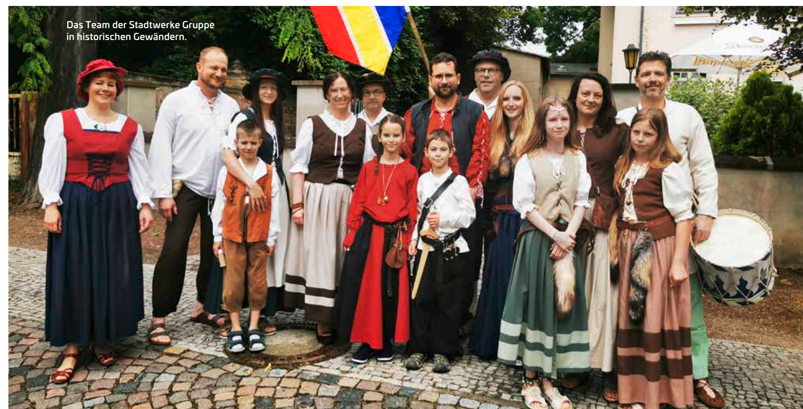
Das Team der Stadtwerke Gruppe in historischen Gewändern.