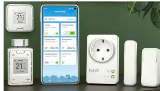
Vernetzte Produkte können Ihren Alltag komfortabler und effizienter machen.

Mit diesem Gerät lässt sich die Heizung steuern. Es ersetzt herkömmliche Thermostate und regelt die Raumtemperatur automatisch – ganz nach Ihren Wünschen!