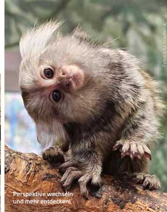
Perspektive wechseln und mehr entdecken!