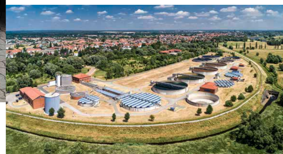
34 Jahre Entwässerungsbetrieb: Bürgerinnen und Bürger können sich auf die Abwasserentsorgung, -reinigung und die Einhaltung des Gewässerschutzes verlassen.