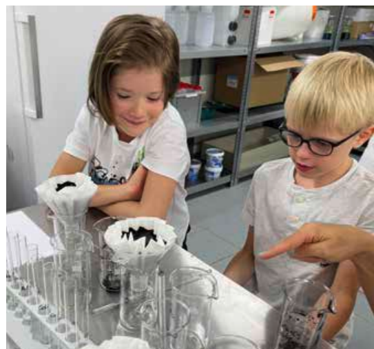
Kommen, beobachten oder mitmachen: Experimente im Labor machen Spaß und vermitteln Wissen.